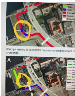
Nuværende udfordringer med dige og overgang mm

Skitsen/billedet som I kan se på præsentationen kunne være en mulig løsning.